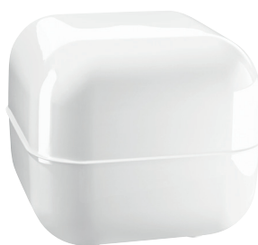
Glossy colour White 1673 C