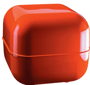
Glossy colour Red 1127 C