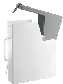
Matt colour Container: White 1735 C Cover: Grey 1395 C