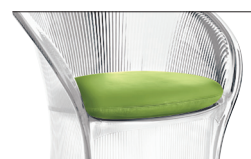
Cushion Green F-355