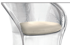
Cushion White F-735