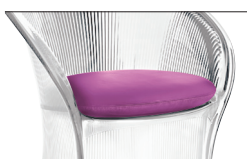
Cushion Fuchsia F-150