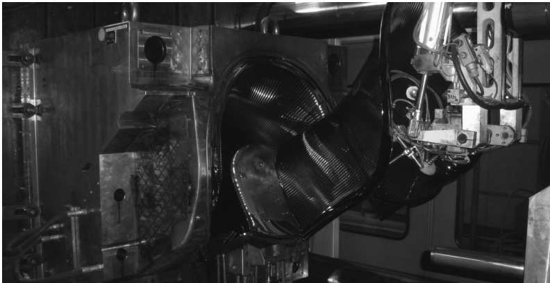
Processo di produzione

Pierre Paulin e Magis, una collaborazione iniziata nel 2002, quando il designer aveva ormai abbandonato il suo lavoro di designer e aveva lasciato Parigi per ritirarsi nelle Cévennes a nord di Montpellier.