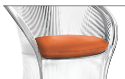
Cushion Orange F-082