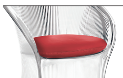
Cushion Red F-125