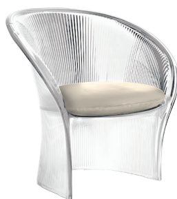
Transparent colour Clear 2540 TR