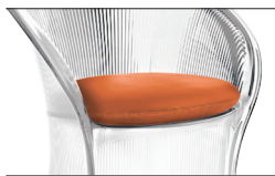
Cushion Orange F-082