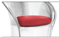
Cushion Red F-125