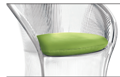
Cushion Green F-355