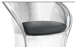
Cushion Grey Anthracite F-502