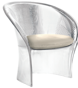
Transparent colour Clear 2540 TR