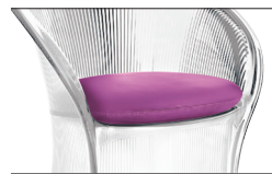
Cushion Fuchsia F-150