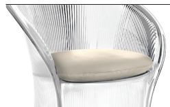
Cushion White F-735