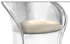
Cushion White F-735

Arm sideways static load test EN 15373:2007, L3 - severe Seat and back static load test EN 15373:2007, L3 - severe Leg forward static load test EN 15373:2007, L3 - severe Leg sideways static load test EN 15373:2007, L3 - severe Arm downwards static load test EN 15373:2007, L3 - severe Seat front edge fatigue test EN 15373:2007, L3 - severe Arm fatigue test EN 15373:2007, L3 - severe Seat and back fatigue test EN 15373:2007, L3 - severe Non-domestic seating. Vertical load on back rest EN 15373:2007, L3 - severe Stability EN 1022:2005 Arm impact test EN 15373:2007, L3 - severe Seat impact test EN 15373:2007, L3 - severe Back impact test EN 15373:2007, L3 - severe