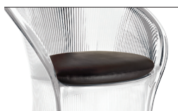
Cushion (fabric) Brown F-071