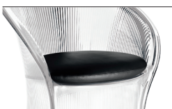
Cushion (leather) Black L-0795