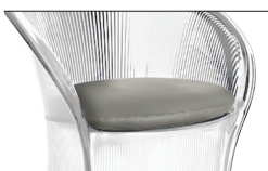
Cushion (fabric) Beige F-455