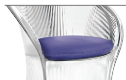
Cushion (fabric) Purple F-486