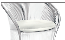
Cushion (leather) White L-0700