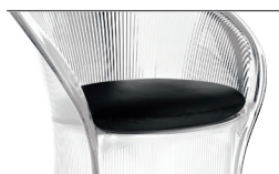
Cushion (fabric) Black F-766