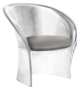
Transparent colour Clear 2540 TR