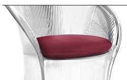
Cushion (fabric) Dark Red F-129