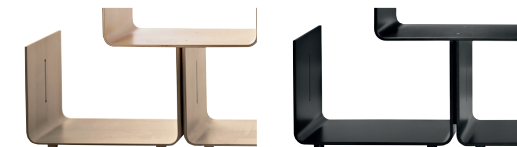
Finish Natural Maple