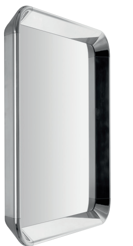
Finish Polished Aluminium