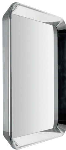
Finish Polished Aluminium