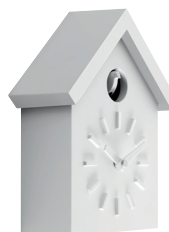
Matt colour Box and little bird: White 1735 C Roof: White 1735 C