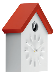
Matt colour Box and little bird: White 1735 C Roof: Orange 1086 C