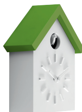
Matt colour Box and little bird: White 1735 C Roof: Green 1342 C