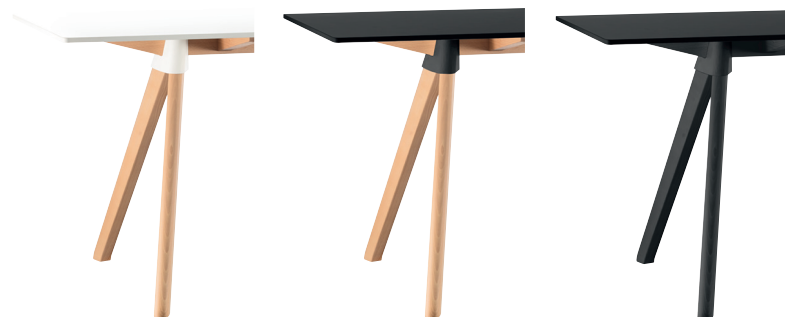
Frame: Natural beech Joint: White 1735 C Top: White 8500