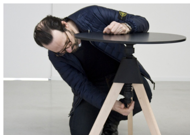
Designer in Magis