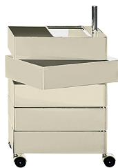
Glossy colour Light Grey 1707 C