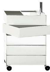
Glossy colour White 1673 C