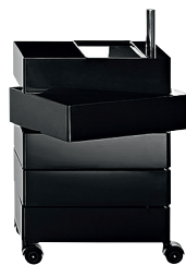
Glossy colour Black 1764 C