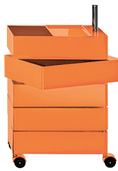
Glossy colour Orange 1658 C