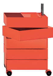
Glossy colour Red 1120 C