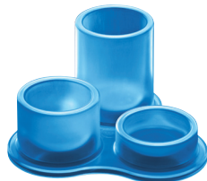
Translucent colour Blue 2040 TL