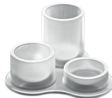
Translucent colour Clear 2080 TL