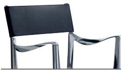
Indoor use Seat + Frame: Polished Back: Black Leather L-0073