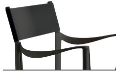
Indoor use Seat + Frame: Black 5130 Back: Black Leather L-0073