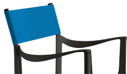
Outdoor use Back: Light Blue R-256 Only for white or black frame