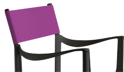
Outdoor use Back: Fuchsia R-151 Only for white or black frame