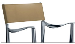
Indoor use Seat + Frame: Polished Back: Natural Leather L-0092