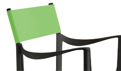
Outdoor use Back: Green R-351 Only for white or black frame