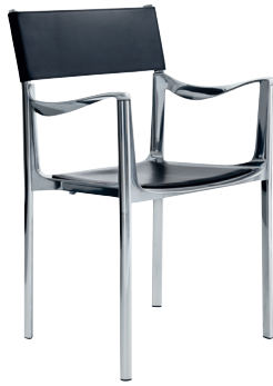
Indoor use Seat + Frame: Polished