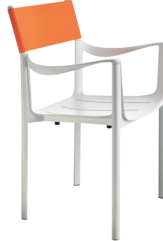
Outdoor use Seat + Frame: White 5110