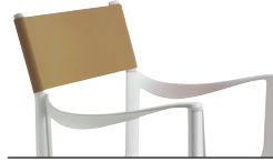
Indoor use Seat + Frame: White 5110 Back: Natural Leather L-0092