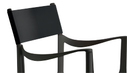
Outdoor use Back: Black R-756 Only for white or black frame