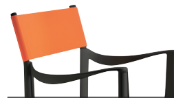
Outdoor use Back: Orange R-081 Only for white or black frame