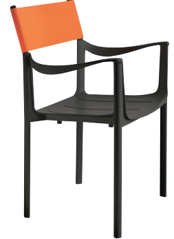
Outdoor use Seat + Frame: Black 5130