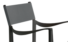
Outdoor use Back: Grey R-503 Only for white or black frame