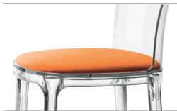
Cushion (fabric) Orange F-080 (542) For all finishes