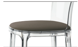
Cushion (fabric) Grey-Brown mélange F-520 (252) Only for transparent and white glossy colour