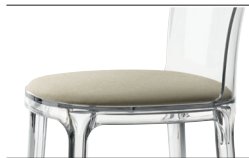
Cushion (fabric) Beige F-265 (232) Only for transparent and white glossy colour