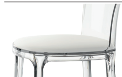
Cushion (leather) White L-0700 For all finishes