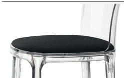
Cushion (fabric) Black F-768 (192) For all finishes