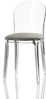
Transparent colour Clear 2540 TR