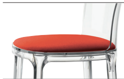
Cushion (fabric) Red F-120 (662) For all finishes