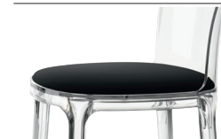
Cushion (leather) Black L-0795 For all finishes