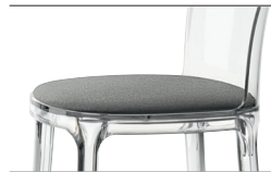
Cushion (fabric) White-Black mélange F-505 (142) For all finishes