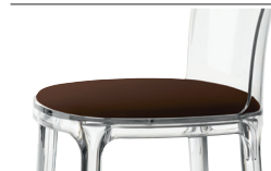
Cushion (leather) Brown L-0751 Only for transparent and white glossy colour