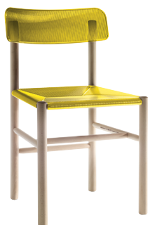
Transparent colour Yellow 2495 TR