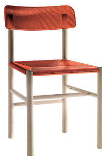
Transparent colour Red 2513 TR