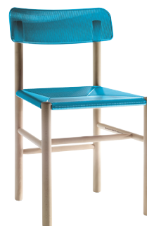
Transparent colour Sky Blue 2531 TR