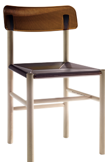
Transparent colour Brown 2503 TR