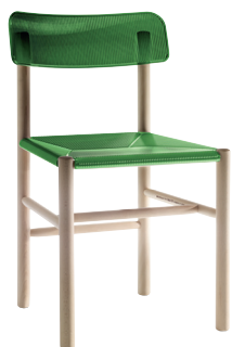
Transparent colour Green 2480 TR