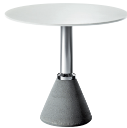
Indoor use Frame: Natural Glossy Top: White 8500