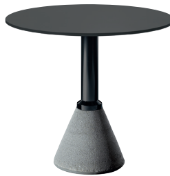
Outdoor use Frame: matt Black Top: Black 8510