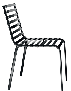
Frame: Black 5130 Slats: Smoke Grey 2017