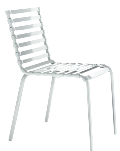
Frame: White 5108 Slats: White 2068