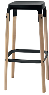
Seat + Foot-rest: Black 5140 Legs: Natural Beech