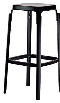
Seat + Foot-rest: Black 5140 Legs: Beech painted Black