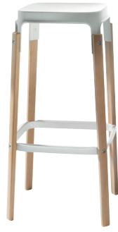
Seat + Foot-rest: White 5108 Legs: Natural Beech