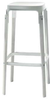
Seat + Foot-rest: White 5108 Legs: Beech painted White