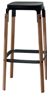
Seat + Foot-rest: Black 5140 Legs: American Walnut