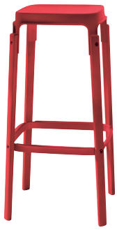
Seat + Foot-rest: Red 5083 Legs: Beech painted Red