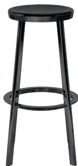
Outdoor matt colour Black 5130