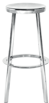
Indoor finish Polished Aluminium