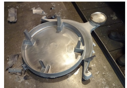
Processo di produzione