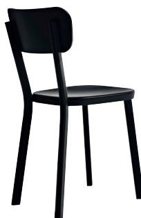
Outdoor use Black 5130