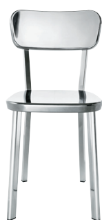
Indoor use Polished Aluminium