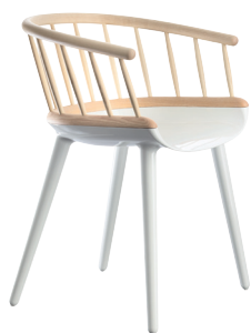
Stick Frame: Glossy White 1736 C Back: Natural solid Ash