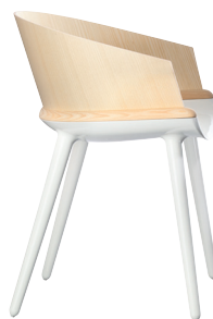
Ply Frame: Glossy White 1736 C Back: Natural Ash plywood