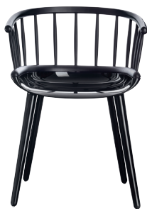
Stick Frame: Glossy Black 1763 C Back: Black solid Ash