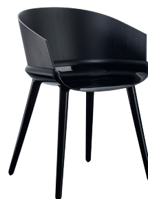
Ply Frame: Glossy Black 1763 C Back: Black Ash plywood