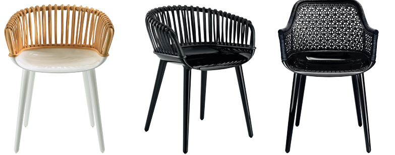
Club Frame: Glossy White 1736 C Back: Natural Wicker