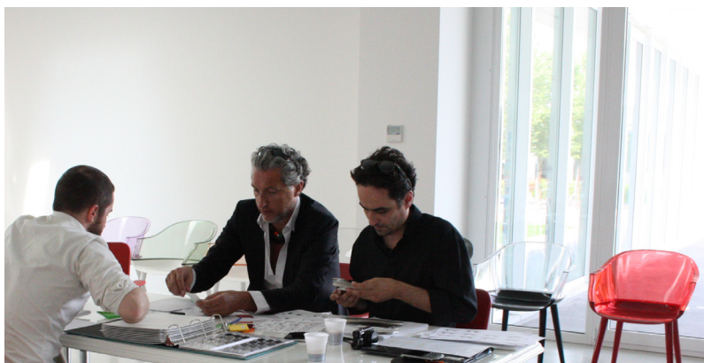
Diseñador en Magis

armazón de policarbonato, materia plástica ultrarresistente y versátil, en el que se pueden aplicar respaldos de distintos materiales: del policarbonato, al mimbre, de la madera maciza al multiestrato, hasta las más recientes versiones acolchadas y tapizadas en tejido o en piel. La posterior evolución de un asiento poético y a su vez tecnológico, acogedor e inesperado, en sintonía con los entornos mas variados.