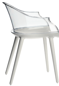
Frame: Glossy White 1736 C Transparent Clear 2540 TR