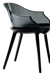
Frame: Glossy Black 1763 C Transparent Smoke Grey 2507 TR