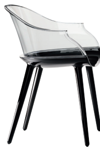
Frame: Glossy Black 1763 C Transparent Clear 2540 TR