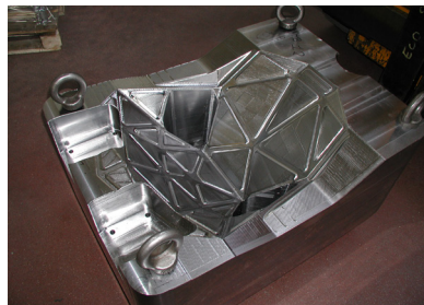
Processus de production