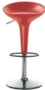
Matt colour Red 1125 C Adjustable height