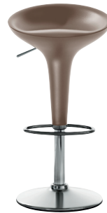
Matt colour Brown 1400 C Adjustable height