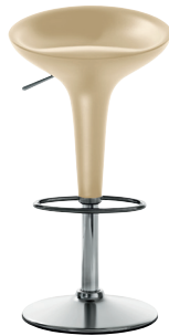
Matt colour Ivory 1020 C Adjustable height