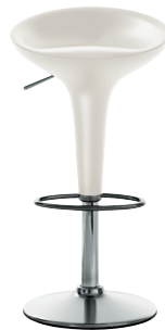
Matt colour White 1690 C Adjustable and fixed height