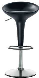
Matt colour Grey Anthracite 1420 C Adjustable and fixed height