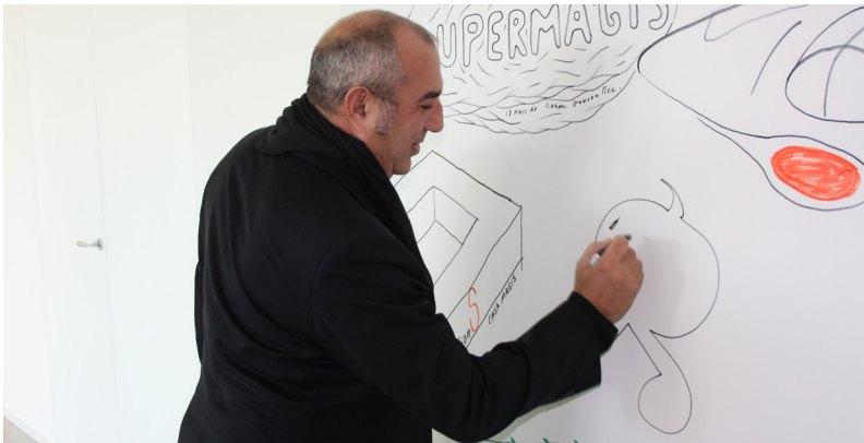
Designer in Magis

La nuova versione di Bombo, proposta in un'unica tonalità titanio anche per la base, con una raffinata finitura glamour, è infatti dotata di un pistone a gas che gli permette di raggiungere anche 80 cm di altezza, rendendolo ancora più funzionale alle esigenze degli ambienti contract, oltre che domestici. Anche la base è stata ottimizzata, per garantire una perfetta stabilità su qualsiasi tipo di pavimentazione: Magis pensa a tutti i dettagli.