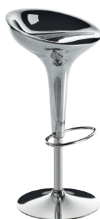
Frame: Stainless Steel Seat: Die-cast aluminium