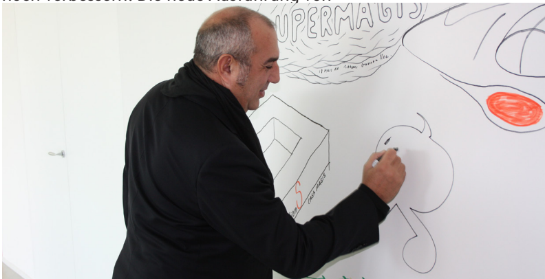
Designer bei Magis

Bombo gibt es nur in Titanium mit einer raffiniert glänzenden Oberfläche, auch für das Untergestell. Sie verfügt über einen Gaskolben, mit dem eine Höhenregulierung bis zu 80 cm möglich ist, wodurch er sich nicht nur an den Wohnbereich, sondern auch an den Contract-Bereich richtet. Auch das Untergestell wurde optimiert, um auf jeder Art Fußboden eine perfekte Stabilität zu gewährleisten: Magis denkt eben an alles.