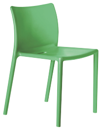
Matt colour Green 1320 C