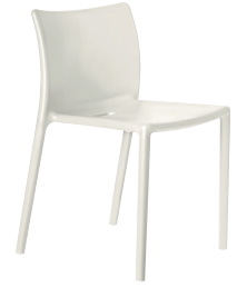
Matt colour White 1730 C