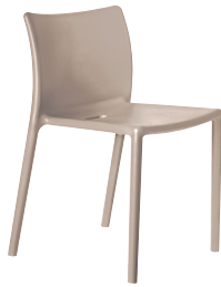
Matt colour Beige 1450 C