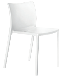
Matt colour Pure White 1690 C