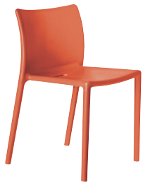
Matt colour Orange 1086 C