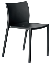
Matt colour Black 1751 C