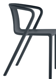
Matt colour Grey Anthracite 1418 C