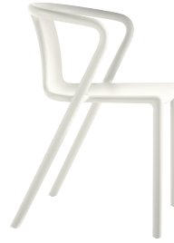
Matt colour White 1730 C