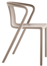
Matt colour Beige 1450 C