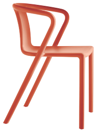
Matt colour Orange 1086 C