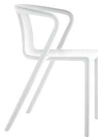
Matt colour Pure White 1690 C