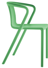
Matt colour Green 1320 C