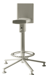
Matt colour Light Grey 1707 C