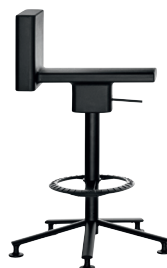
Matt colour Black 1764 C

Carico statico poggiapiedi EN 1728:2000, L3 - severo Carico statico sul sedile-schienale EN 1728:2000, L3 - severo Fatica fronte anteriore sedile EN 15373:2007, L3 - severo Resistenza a fatica dei braccioli EN 15373:2007, L3 - severo Resistenza a fatica del sedile-schienale EN 15373:2007, L3 - severo Resistenza a fatica del sedile-schienale EN 15373:2007, L3 - severo Sedie non domestiche. Carico statico verticale schienale EN 15373:2007, L3 - severo Sedie non domestiche. Requisiti di sicurezza EN 15373:2007, L3 - severo Sedie non domestiche. Resistenza a fatica appoggiatesta EN 15373:2007, L3 - severo Stabilità EN 1335-3:2009 Urto contro il bracciolo EN 15373:2007, L3 - severo Urto sul sedile EN 15373:2007, L3 - severo Urto sullo schienale EN 15373:2007, L3 - severo